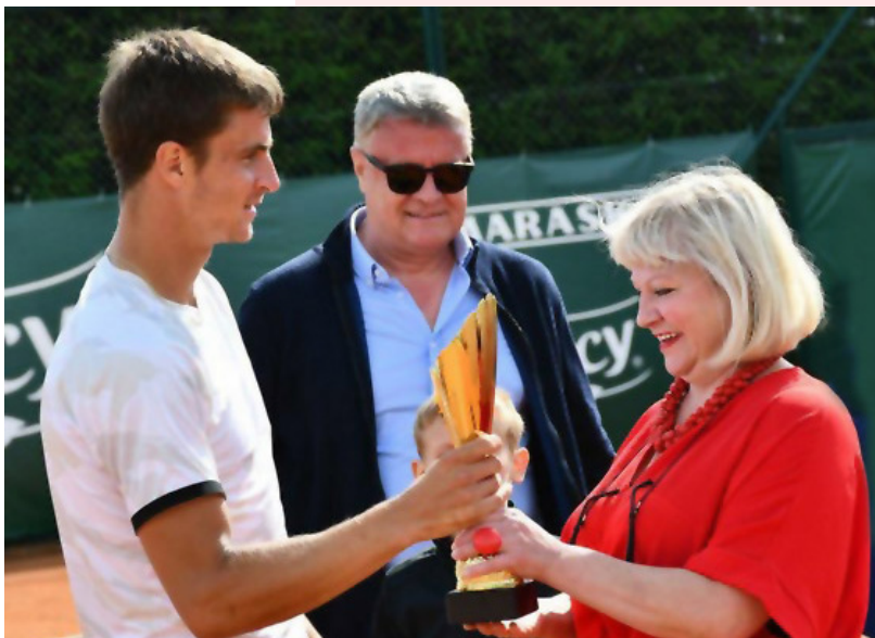
Kiseljak: Ministrica Vlasisavljević nazočila dodjeli nagrada na ITF turniru „Kiseljak Open“

„Sretna sam što se san jedne obitelji, započet prije 24 godine, pretvorio u san mnogih u Bosni i Hercegovini, ali i izvan nje“, zaključila je ministrica Vlasisavljević nakon još jednog uspješno organiziranog teniskog turnira u Kiseljaku.