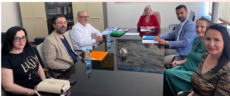
Ministrica s predstavnicima Odbora za obrazovanje, znanost, kulturu i šport Zastupničkog doma Parlamenta Federacije Bosne i Hercegovine