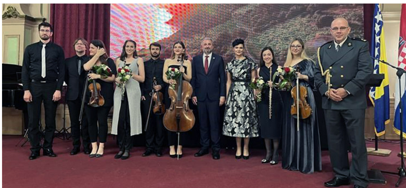
Ministrica na svečanom prijemu povodom obilježavanja Dana državnosti Republike Hrvatske

Kinoteka Bosne i Hercegovine kao i sve druge institucije kulture, u Federalnom ministarstvu kulture i športa imaju partnera za saradnju i konkretnije rješavanje problema, sukladno mogućnostima i nadležnostima, poruka je ministrice Vlaisavljević.