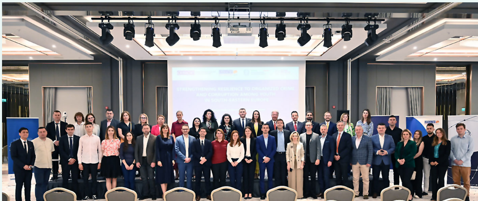
Skoplje, Sjeverna Makedonija: Pomoćnik ministrice, Adis Salkić, na konferenciji „Jačanje otpornosti na organizovani kriminal i korupciju među mladima u Jugoistočnoj Evropi“

Obilježen Međunarodni dan mladih – 12. august