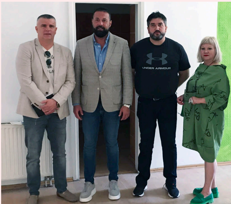
Ministrica u posjeti Paraolimpijskom komitetu BiH

Imajući u vidu sve uspjehe paraolimpijskih sportista nužno je pomoći Komitetu da napravi uslove za dostojanstven rad i stvaranje boljeg okruženja za sportaše.