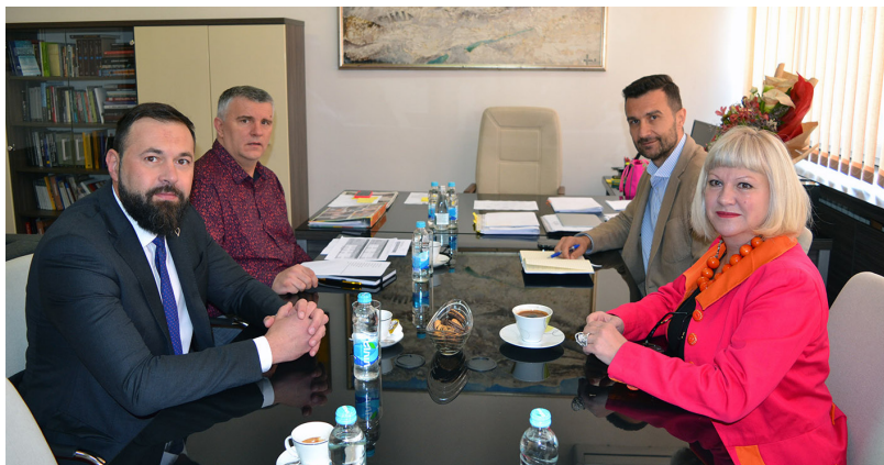
Ministrica Sanja Vlasisavljević sastala se sa ministrom kulture i sporta Kantona Sarajevo, Kenanom Magdomom

Bila je ovo prilika za razmjenu iskustava u domenu kulture i sporta na federalnom i kantonalnom nivou, ali i za dogovor konkretnih zajedničkih koraka u predstojećem periodu.