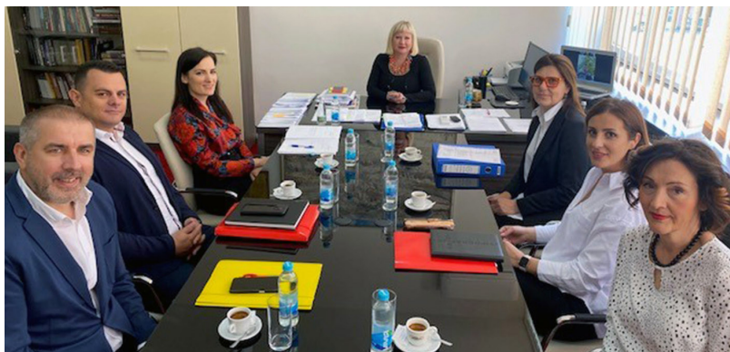
Sastanak u Federalnom ministarstvu kulture i sporta: Ministrica Vlaisavljević i predstavnici Filmskog Centra Sarajevo o prevladavanju neriješenih pitanja

Ministrica je naglasila kako je raduje što je kroz dramski, literarni, muzički i likovni karakter Festivala „FEDU”, ponuđena prilika i adekvatan prostor školarcima za umjetničko stvaralaštvo i prezentovanje i njegovanje brojnih talenata, ali i mogućnost kvalitetnog korištenja slobodnog vremena.