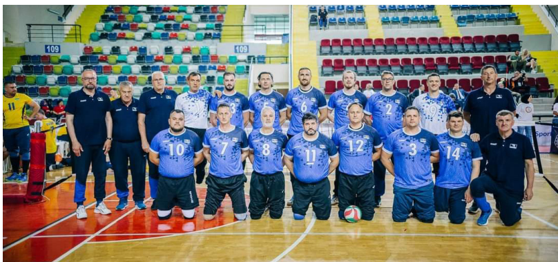
Čestitamo: Reprezentacija BiH u sjedećoj odbojki odbranila titulu prvaka Zlatne lige nacija