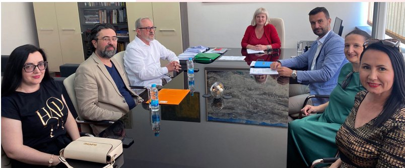
Ministrica s predstavnicima Odbora za obrazovanje, nauku, kulturu i sport Predstavničkog doma Parlamenta Federacije Bosne i Hercegovine