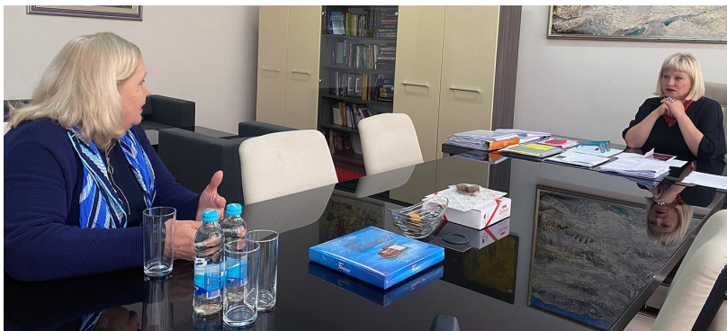
Vlaisavljević na sastanku s v.d. ravnateljicom Kinoteke Bosne i Hercegovine, Devletom Filipović

Kinoteka Bosne i Hercegovine kao i sve druge institucije kulture, u Federalnom ministarstvu kulture i športa imaju partnera za saradnju i konkretnije rješavanje problema, u skladu s mogućnostima i nadležnostima, poruka je ministricе Vlaisavljević.