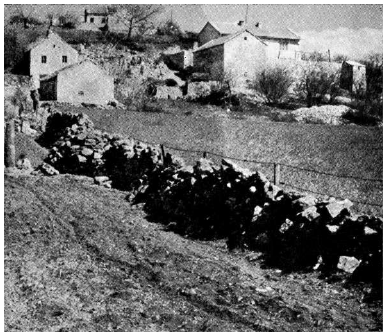
Sl. 1 Ostaci iskopani iz temeljnih zidova rimske građevine u Hodbini marta mj. 1959 godine

U selu Hodbini, nedaleko od Bune, marta 1959 godine došlo je takođe do jednog slučajnog arheološkog nalaza. Na lokalitetu zv. Alibegovina Gozder Mujo, kopajući zemljište za sadnju vinove loze, izvadio je sa radnicima za nekoliko dana oko 10 m 3 kamena. Po iskopanom materijalu kao i po podacima dobijenim od očevidaca može se zaključiti da se radi o ostacima jedne veće građevine rimskog doba. Od mnogobrojnih ostataka, po-