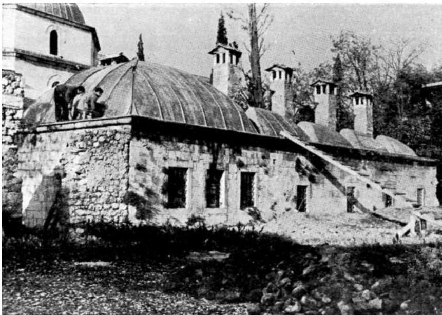
Sl. 3 Zgrada medrese u Počitelju