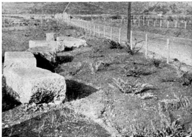
Sl. 2 Radimlja

Zapuštena i obrasla korovom nekropola sa nameatala potrebom uređenja i ograđivanja terena. Zato se najprije pristupilo čišćenju nekropole s južne strane puta Domanovići — Stolac. S obzirom da je dio nekropole svojevremeno preoran, teren je bio neravan — ispunjen brežuljcima i uvalama. Grupa radnika pod rukovodstvom predstavnika Zavoda poravnala je taj teren i očistila ga od kamena i korova. Potom se prešlo na niveliranje zapadnog dijela nekropole na južnoj strani puta. Na ovom dijelu nalazila se jedna ovela humka za koju se predpostavljalo da je možda nastala u ilirsko doba ili iz vremena postanka nekropole. U cilju utvrđivanja stvarnog stanja napravljeno je nekoliko sondi pomoću kojih je ustanovljeno da je humka novijeg datuma — nastala nabacivanjem zemlje i šljunka prilikom trasiranja i izgradnje puta Domanovići—Stolac, koji je ustvari presjekao nekro-