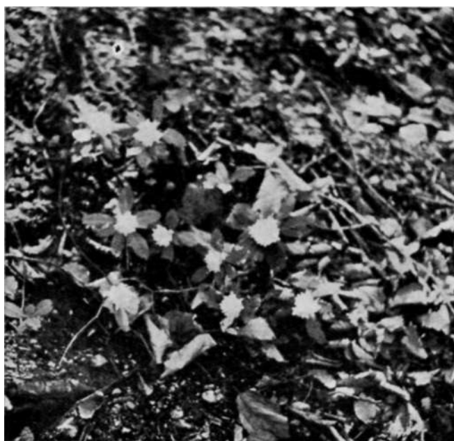
Velika kolonija borike ( Daphne blagayana Frey.) u bukvoj šumi na dolomitu južnih padina stupnika (Planina Igman — Bjelašnica)