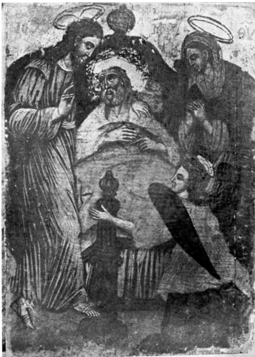
Sl. 4 »Smrt Josifova«, ikona iz srp. pravosl. crkve u Ilijašu kod Sarajeva

vrlo žive. Kako su sve tri gore spomenute crkve nastale u toku XVI vijeka, a žitomislička kao zadnja u nizu, oslikana 1609, to možemo pretpostaviti da su sve ikone zapadne ikonografije koje se danas nalaze u krugu gore spomenutih crkava u koji spadaju i obje crkve u Mostaru donesene kao pokloni negdje u vremenu do nastupa episkopa hercegovačkog Arsenija (1654), kad se propisima pravoslavne crkve počela poklanjati stroga pažnja, što u ranije tursko vrijeme nije bilo. Prema tome i naša slika mogla je prije 1654. doći u Ošanić kao poklon porodice Miloradovića. Kasnije nabavljene ikone iz Mletaka nose već sve pravoslavne odlike samo s pečatom italokritske ili poznogrčke škole. Kao primjer možemo navesti ikonu Deisis u Trijebnju koju je 1775. kupio u Mlecima Hristofor, žitomislički monah, za četiri i po dukata.