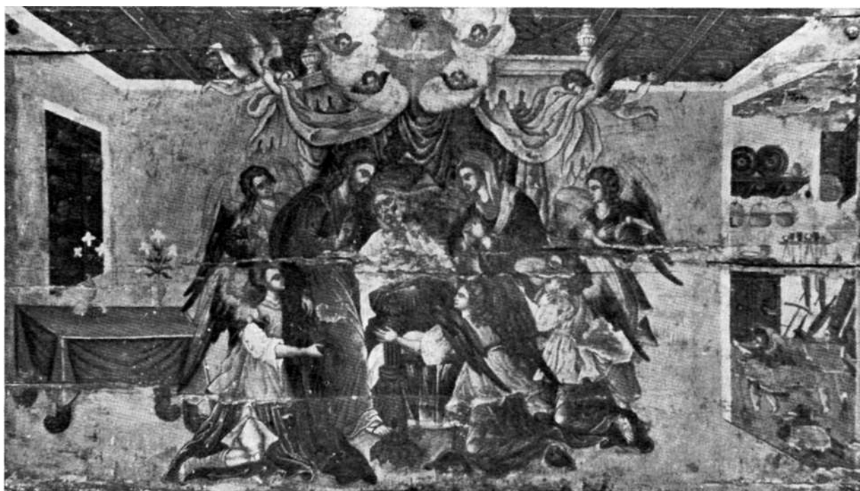
Sl. 1 »Smrt Josifova«, ikona iz Ošanića, sad u Srp. prav. parohijskom uredu u Stocu.