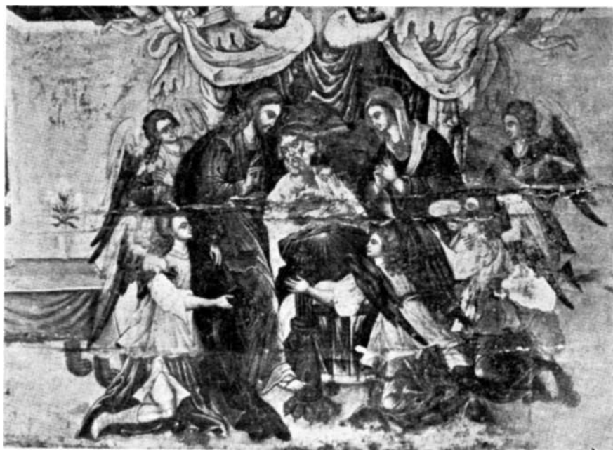
Sl. 3 Josif na odru. Detalj slike »Smrt Josifova« iz Srp. prav. parohijskog ureda u Stocu.

Ako pogledamo opisanu sliku letimično, dobićemo doista dojam velike živosti, izazvane doga-