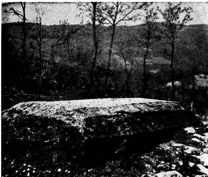
Sl. 4. Sanduk br. 1 na drugoj grupi stećaka.