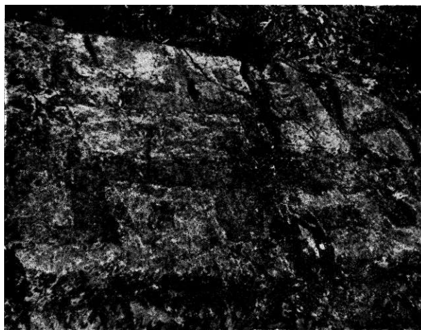
Sl. 6. Motiv na sanduku br. 3 četvrte grupe stećaka

za to nema pouzdanih podataka, ipak sve okolnosti upućuje na pomisao o važnijem srednjovjekovnom području u kojemu je selo Kosače značilo neki centar, možda baš zavičaj porodice Kosača. U tome slučaju nekropola na Križevcu, koja inače izgleda da pripada ranijem periodu stećaka, mogla bi biti porodično groblje Kosača, odnosno Hranića, kako su se Kosače ranije zvale. Među nadgrobnim spomenicima svakako onaj sa motivom antropomorfnog krsta pretstavlja veliku važnost i faktor po kojemu se može govoriti o pripadnosti tih stećaka, odnosno o vjeri srednjovjekovnih Hranića-Kosača.