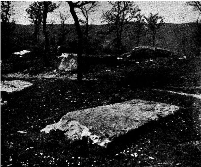
Sl. 3. Pogled sa sjeveroistočne strane na drugu grupu stećaka.

Mislim da je od interesa da saopštim i neke podatke koje sam prikupio na samome terenu. U Kosačama kao i u svim okolnim selima odavno