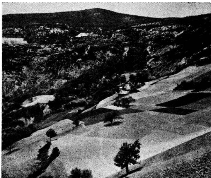
Sl. 1. Pogled sa jugoistočne strane na selo Kosače.

U našem slučaju Ledine su relativno najinteresantnije. To je ravničasta dugačka kosa pružena po pravcu sjever-jug. Na njoj su postavljene 4 skupine stećaka čiji se raspored vidi iz priložene skice. (Sl. br. 2). U prvoj skupini, počevši sa sjevera, imaju 4 stećka (1 sanduk i 3 ploče), a u drugoj,