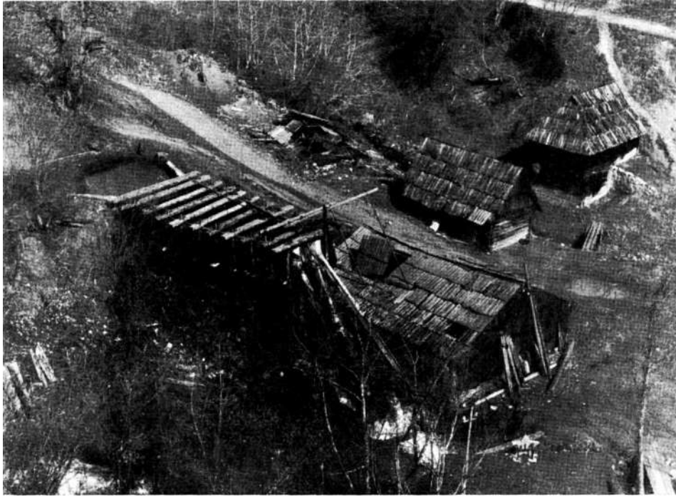
Sl. 2 Željezni majdani drvene konstrukcije (Fotosnimak majdana u selu Gornje Očevije)

rada još nije utrnuo, već aktivno živi, bez sumnje je i najidealnija prilika za otvaranje muzeja tehnike pod otvorenim nebom. Muzeja otvorenog najširoj javnosti koja će moći da prati proces rada izrade željeznih predmeta u formi kako se on odvijao unazad nekoliko stoljeća u srednjobosanskim rudarskim centrima. U tom smislu uzev — majdani željeza u Očevijama — mogu ispuniti i sve one zahtjeve, koje, danas, postavlja savremena muzeologija pred svoje muzejske ustanove u oblasti njihovog prosvjetno-vaspitnog djelovanja. Skansen u Gornjim Očevijama, koji je ostao sačuvan, bez našeg posredstva, ispunjava sve potrebne uslove za tu namjenu. Samo je potrebno skrenuti pažnju javnosti i omogućiti joj pristup, usto pronaći forme što uspješnije, naučno ispravne, interpretacije njegove historijske vrijednosti, i značaja za proučavanje privredne historije Bosne i Hercegovine i razvoja željezne industrije uopšte. Apsurdan bi, međutim, bio svaki pokušaj gašenja majdana zbog njihovog prenosa u neki centralni muzej, budući su ovako daleko razumljiviji, organski povezani sa svojom prirodnom okolinom, pod vlastitim podnebljem. Nasilnim prenošenjem u muzej oni bi postali umrtvljeni predmeti, lišeni stvarnog života i svojih izvornih spomeničkih vrijednosti.