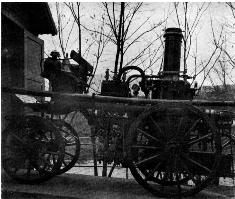
Sl. 3 Vatrogasna pumpa, iz 1893 god. (Svojina: Drvni kombinat »Krivaja«, Zavidovići)

jala — organizacija čuvanja i prezentacije spomenika tehnike u našoj Republici, mogla bi se usredrediti na slijedeće pokušaje i rješenja: