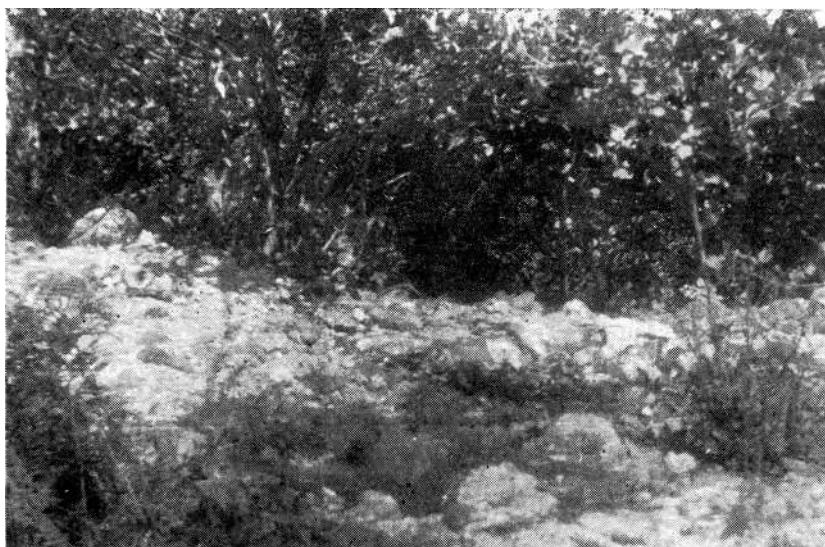
Sl. 1. Detalj rimskih zidina na lokalitetu Zidine u Laktašima