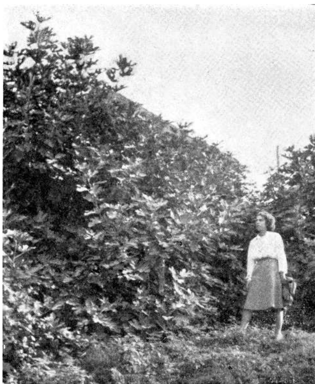
Sl. 3. Gornji Šeher kod Banje Luke. Bujno razvijena divlja smokva — Ficus carica — pod uticajem termalne vode. — Ueppig entwickelte wilde Feigen unter dem Einfluss der Thermalquellen in Gornji Šeher bei Banja Luka

Samo se po sebi razumije da se ovo interesantno nalazište kod Gornjeg Šehera mora staviti pod zaštitu, i to ne samo zbog jedinstvenosti ove pojave, već i zbog opasnosti koja prijete lokalitetima ove naravi, gdje se u vezi s izgradnjom banje ili njenim preuređivanjem, kao i kaptiranjem pojedinih izvora može dovesti u pitanje opstanak ove biljke. Zato se na vrijeme moraju poduzeti