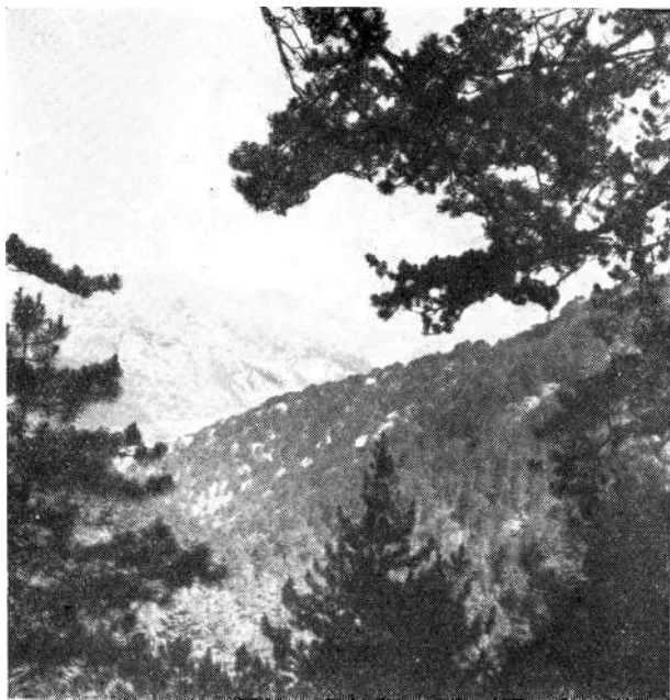
Sl. 1. Suhi Dol kod Konjica. Pogled na dio dolomitnog kompleksa predviđenog za zaštitno područje. U pozadini dolina Neretve. — Suhi Dol — das trockene Tal — bei Konjic. Blick auf einen Teil des Dolomit-komplexes, welcher unter Naturschutz gestellt werden soll.