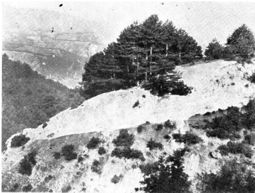
Sl. 4. Na kraju Suhog Dola kod Konjica. Tipična slika erozije na dolomitu. — Am Ende des Suhi Dol bei Konjic. Typisches Erosionsbild auf Dolomit