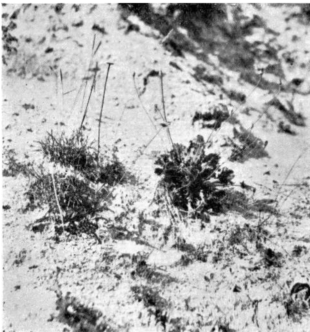
Sl. 2. Među pionirskom vegetacijom na otvorenim siparima nalazimo svojstvene vrste dolomita. U sredini: Reichardia macrophylla Vis. et Panč. — Unter der Pionirvegetation offener Rohböden sind die Dolomitspezialisten zu finden. In der Mitte des Bildes: Reichardia macrophylla Vis. et Panč

Centaurea Triumphetti All. f. pseudomontana K. Maly je naročito čest na Vrtaljici, gdje raste na boljim, humusom nešto bogatijim staništima. Kako iz naziva proizlazi, ova vrsta liči po habitusu na svojtu Centaurea montana . Lišće je široko, krupno, te vremenom u potpunosti gubi paučinastu navlaku.