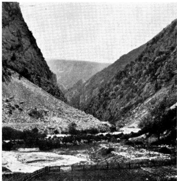
Dolina Unca po izlasku iz klisura više bivšeg Rmanj manastira.

Od Martin-Broda jedan kilometar nizvodno uliva se s desne strane u Unu rijeka Unac, koja izvire više Drvara. Od utoka Unca u Unu 2 km uzvodno uz Unac nalazi se t.zv. »Crni Izvor« koji daje preko polovine količine vode Uncu, a sam