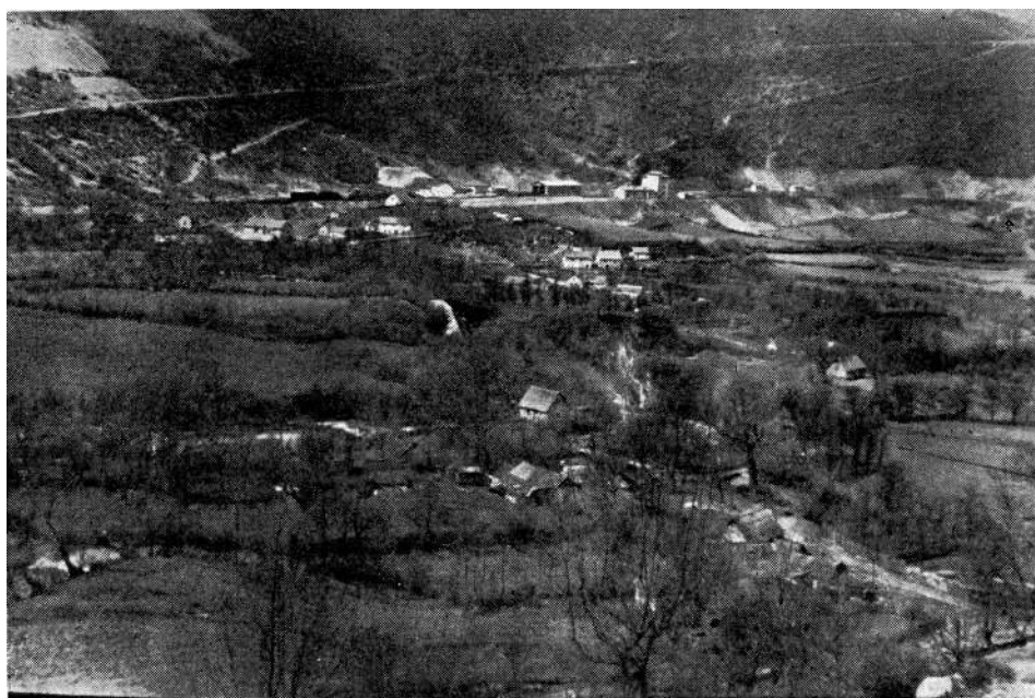
Pogled na Martin-Brod, dio Donjeg Slapa.

vrijeme našeg boravka obišli smo čitavo sedreno područje, kao i njegovu neposrednu okolinu. Ova naša posjeta Martin-Brodu pala je u vrijeme velikih poplava u donjem toku Une i Sane, te je i naš rad bio obiljem vode u gornjem toku Une veoma otežan. Zato smatramo ovaj izvještaj prethodnim izvještajem, koji ćemo, svakako, jedamput kasnije za mirnijeg vodostaja moći nadopuniti. Zasada podnosimo evo ovaj izvještaj.