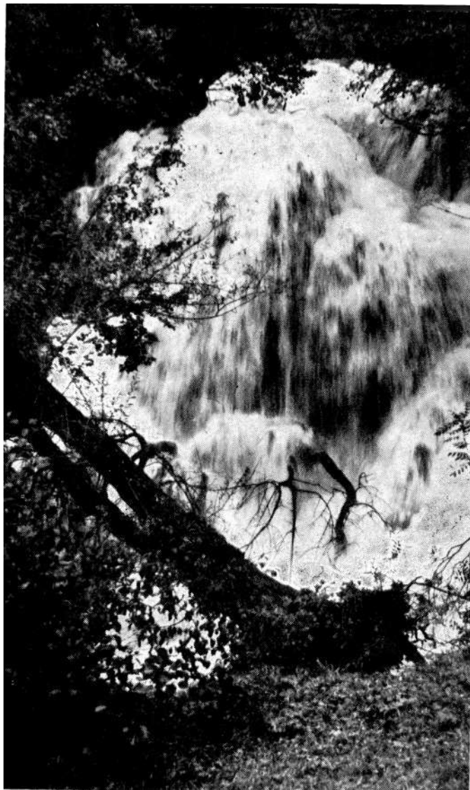
Pogled na Srednji Slap iz Male Špilje sa susjednog brijega.

Mi dosada nismo iscrpno pregledali svu literaturu koja postoji o Martin-Brodu i to zbog kratkoće vremena. Ali dužnost nam je ovdje da upozorimo na nekoliko radova u kojim se iznose