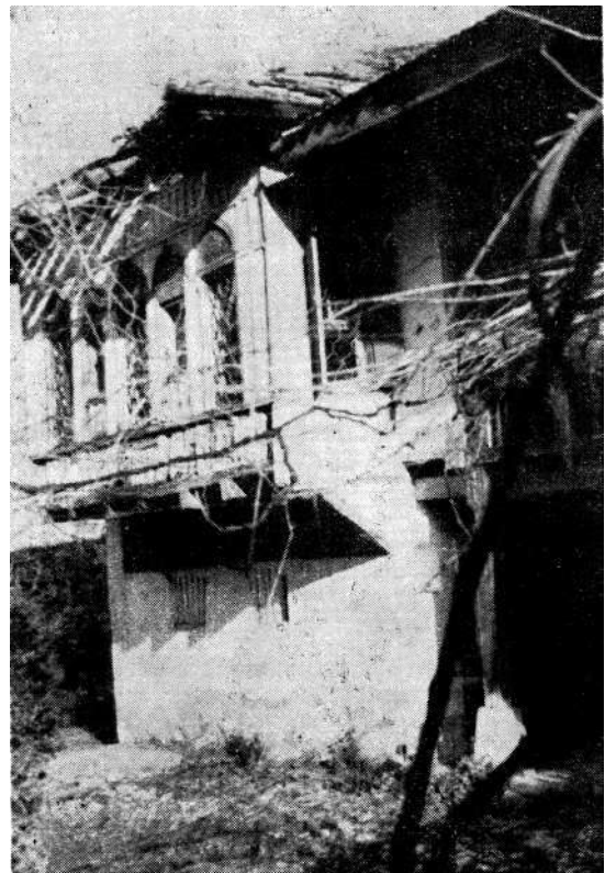
Kolakovića kuća u Blagaju — detalj — prije konzervacije

Resulbegovića kuća u Trebinju. U ovom interesantnom objektu u južnoj Hercegovini bio je smješten prije rata privatni muzej. U godinama rata zgrada je znatno