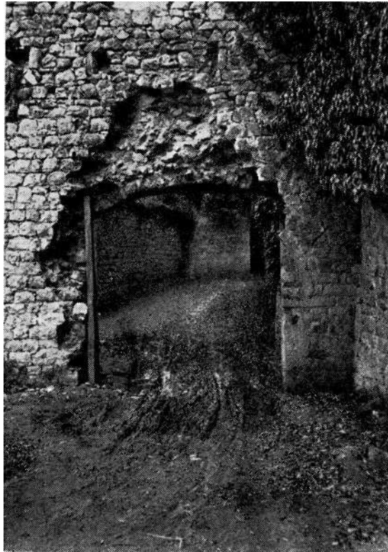
Ulaz u Stari grad Ostrožac prije konzervacije.

Hamam u Mostaru potječe po svoj prilici iz XVI vijeka, a po svojoj tlocrtnoj koncepciji znatno se razlikuje od drugih hamama koje imamo u zemlji. Koncepcijom prošle i početkom ove godine rađeno je na studiji adaptacije hamama za slikarski atelje ali do projekta zahvata nije došlo, jer se u međuvremenu odustalo od takve namjene. Pokazalo se da je hamam praktički nemoguće dovoljno izolirati od vlage, kao i to da bi adaptacija za atelje iziskivala znatne izmjene na samom objektu. Konačno, ova faza radova na