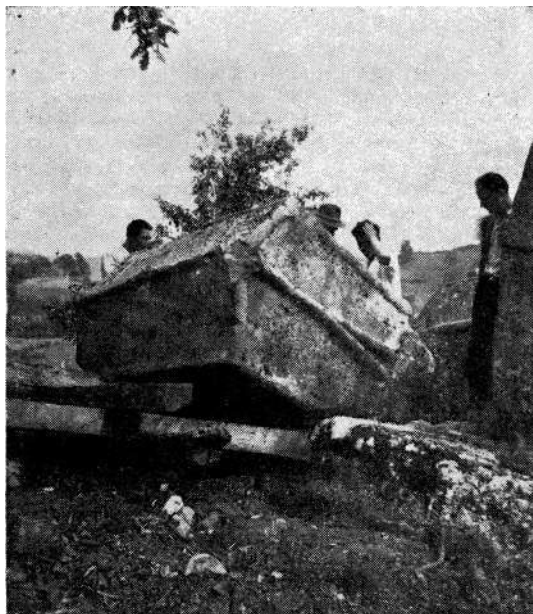
Uređenje srednjovjekovne nekropole »Vojvode Momčila« kod Teslića

U drugoj polovici 1954. god. izašla je iz štampe, u izdanju Zavoda knjiga »Kupres«, od Šefika Bešlićića, kao sveska broj V edicije Srednjovjekovnih nadgrobnih spomenika B i H. a Zemaljski muzej je dao u štampu knjigu »Ljubuški« od Marka Vege, kao svesku br. VI iste edicije. Osim toga, u »Analima Historiskog Instituta Jugoslavenske Akademije znanosti i umjetnosti u Dubrovniku II. 1953. go-