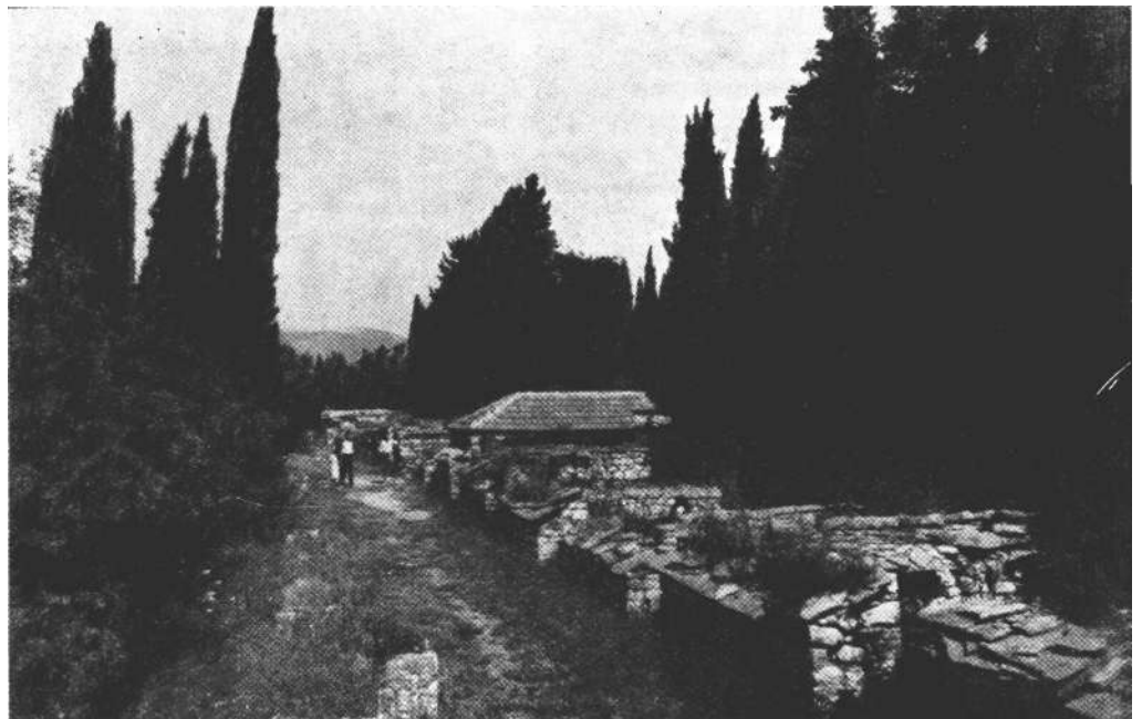
Sjeveroistočna strana Mogorjela u zapuštenom stanju po završetku rata