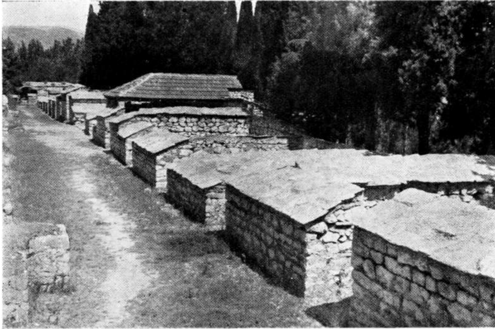
Isti pogled kao na slikama br. 3 i 4. Stanje nakon izvedene opravke 1952 godine

zorno djelovanje na tom spomeniku kulture. Žile nasađenog drveća, a naročito brojnih čempresa, ne idu u širinu, nego u dubinu. Ne samo da te žile ne probijaju sebi put u horizontalnom pravcu, dakle prema zidovima, nego još svojom okomitom tendencijom i jačinom štite malo nagnuto tlo od sklizanja i odrona. Od nasađene bjelogorice na slobodnom prostoru nekadašnjeg dvorišta unutar zidova samo se brijest ( Ulmus campestris ) pokazao kao nepoželjan gost, jer su njegove daleko rasprostranjene žile mogle vremenom postati opasne za građevinu. Ovo je spriječeno. Za drugo drveće nisu se mogle ustanoviti slične osobine.