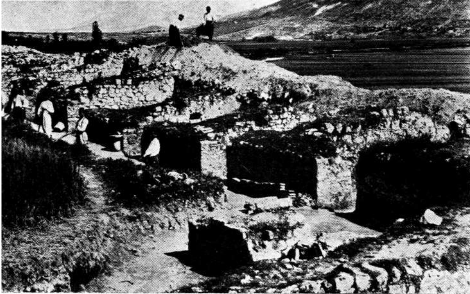
Sjeveroistočna strana Mogorjela. Snimak iz doba otkopavanja, vjerojatno 1899 godine. Pogled od juga prema sjeveru.

vrlo jaka, toliko, da jednostavni krovovi od crijepa ne mogu izdržati pritisak. Kasna jesen i zima dosta su kišoviti, dok je ljeto vrlo suho i vruće. Prema starijim podacima 11 prosječna godišnja temperatura iznosi 13,9° C, najniža moguća temperatura zabilježena je 1912 godine sa -6,8° C, a maksimalna 1916 godine sa 38° C. Područje spada u pojas mediteranske klime, pa tako i biljni svijet Mogorjela nosi na sebi pečat naše primorske vegetacije. Kompleks ruševina uokviruju redovi čempresa ( Cupressus sempervirens L.), koji tako u neku ruku čine zid protiv prejake sunčane žege, udaraca vjetra, kišnih kapljica i sličnih atmosferskih elemenata. Zajedno sa drvećem koje je zasađeno na slobodnom unutrašnjem prostoru, ovi čempresi vrše u neku ruku funkciju klimatskog regulatora. I u doba najveće ljetne žege ima u Mo-