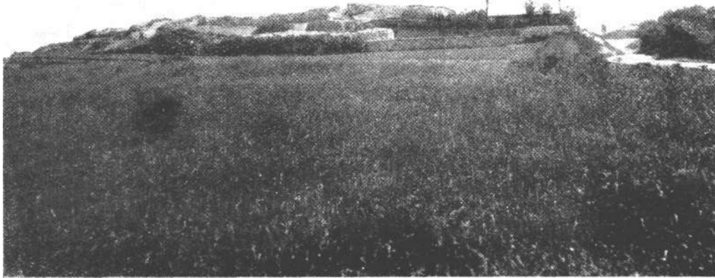
Mogorjelo 1902 godine. Objekt oslobođen naslaga zemlje, ali još nije provedena konzervacija zidova niti zasadeno drveće. Pogled sa sjevera.

stika razorena je po svoj prilici u doba kada je sagrađen objekat kojega sada vidimo. Možda ne bismo mnogo pogriješili ako bismo onu prvu građevinu datirali u I vijek nove ere, iako nam nisu poznati elementi za njeno vremensko opredjeljivanje (ukoliko su uopće vršena istraživanja u toj dubini). Koncem III, ili tokom IV vijeka n. e. izgrađen je na tom mjestu objekat o kome ovdje govorimo, a nakon što je on propao u nekoj katastrofi oko 400-te godine nove ere, prostor ruševina poslužio je kao ukopno mjesto okolnog stanovništva. Ne zna se točno vrijeme kada se započelo tim ukopavanjem, no tokom Srednjeg vijeka izgrađene su ovdje dvije bazilike, od kojih je sjeverna imala kriptu. 8 Danas jedva naziremo njihove tragove, jer su obje građevine takoreći zbrisane sa površine zemlje, budući da su, izuzev kripe, horizontom nadvisivale objekat kome je bilo posvećeno otkopavanje od 1899—1903 godine.